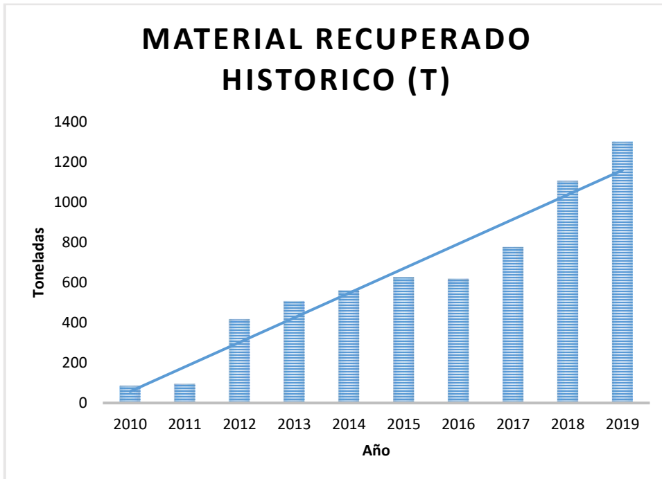
Gráfico 2. Histórico aceite recuperado